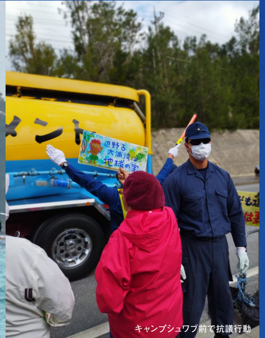
キャンプシュワブ前で抗議行動