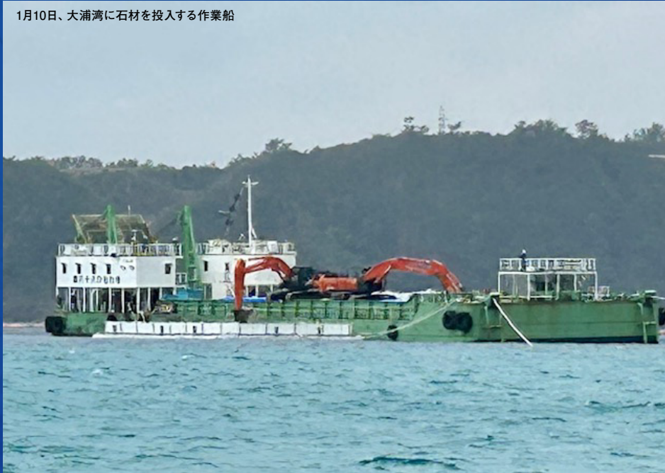
1月10日、大浦湾に石材を投入する作業船