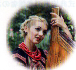
歌・バンドウラ/カテリーナ

東日本大震災から八年。 警察庁のまとめによると死者・行方不明者は一八、四〇〇人余り、 震災・原発事故による犠牲者は合わせて二二、〇〇〇人余りに上っています。 復興庁によれば避難者も全体ではまだ約五四、〇〇〇人を数え、 福島県からは、およそ三三、〇〇〇人が放射能汚染によって、 ふるさとを追われたままです。