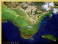
埋め立てられようとしている海域

ジュゴンの餌場である海草藻場、海ガメが産卵する砂浜、アジサシが営巣する岩場、サンゴの住み家、貴重な生物たちの生きる場が奪われようとしています。希少サンゴや貴重なサンゴ礁も生き埋めになってしまいます。